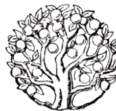
Birkagårdens symbol. En ek.

minst utbildade invånarna. Settlementen generellt verkade för sociala reformer i syfte att förbättra levnadsvillkoren för människor. Settlementrörelsen uppstod således som en reaktion bland de välbeställda mot industrisamhällets överutnyttjande och förtryck av den arbetande befolkningen.