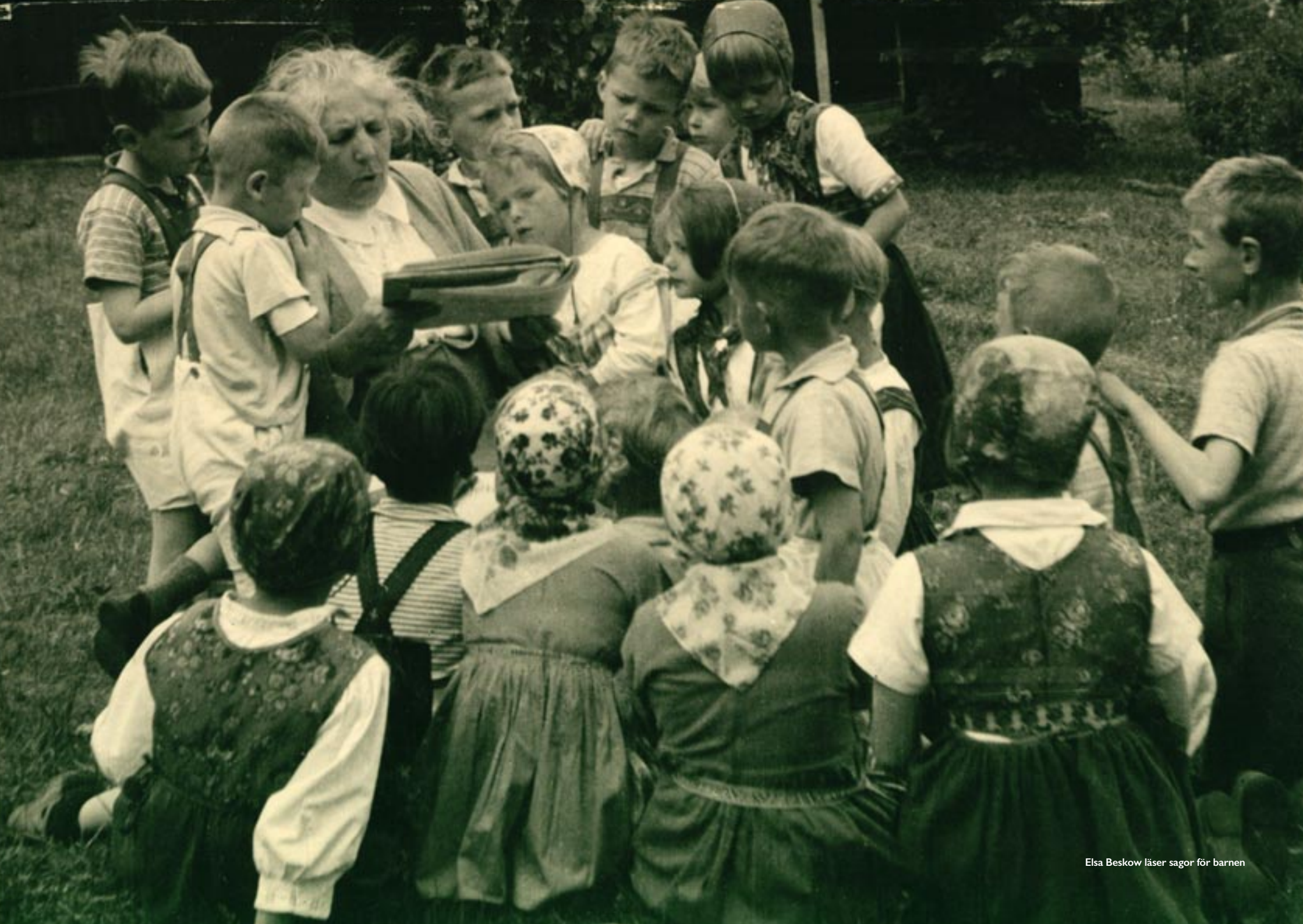
Elsa Beskow läser sagor för barnen