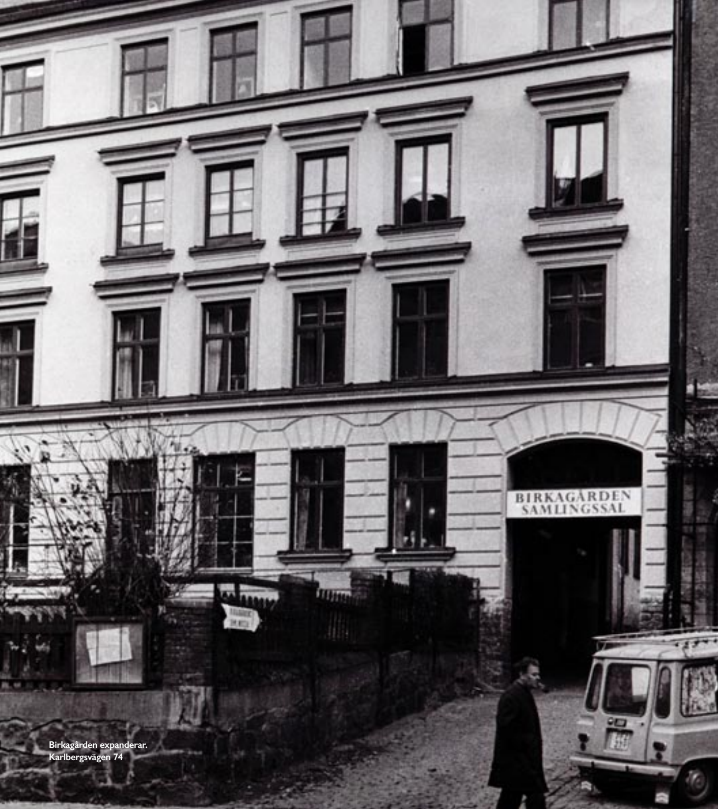
Birkagården expanderar. Karlbergsvägen 74