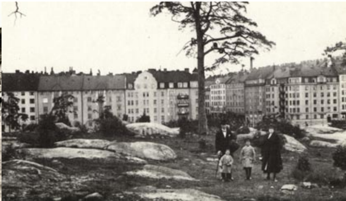
Birkagården sett från Solna skogen (där nu Karolinska Institutet och Norra länken breder ut sig). Tidigt 1900-tal.