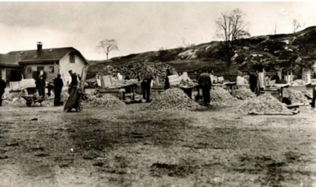
Makadamslagning vid Röda berget (numera Rödabergs-området) Rörstrands utmarker. Troligtvis mitten av 1800-talet.

med industrialiseringen hade arbetarna börjat organisera sig och arbetarrörelsen hade börjat formera sig i olika fackförbund. En viktig ingrediens i sammanhanget som nämnts var oron inom den etablerade delen av samhället. Här är inte platsen att teckna vidden av de motkrafter som fanns i Sverige och som strävade mot att utveckla samhället i en bättre riktning. I sammanhanget är det emellertid viktigt att lyfta fram Centralförbundet för socialt arbete (CSA) som bildades 1903 och som arbetade för att uppmärksamma "den sociala frågan".