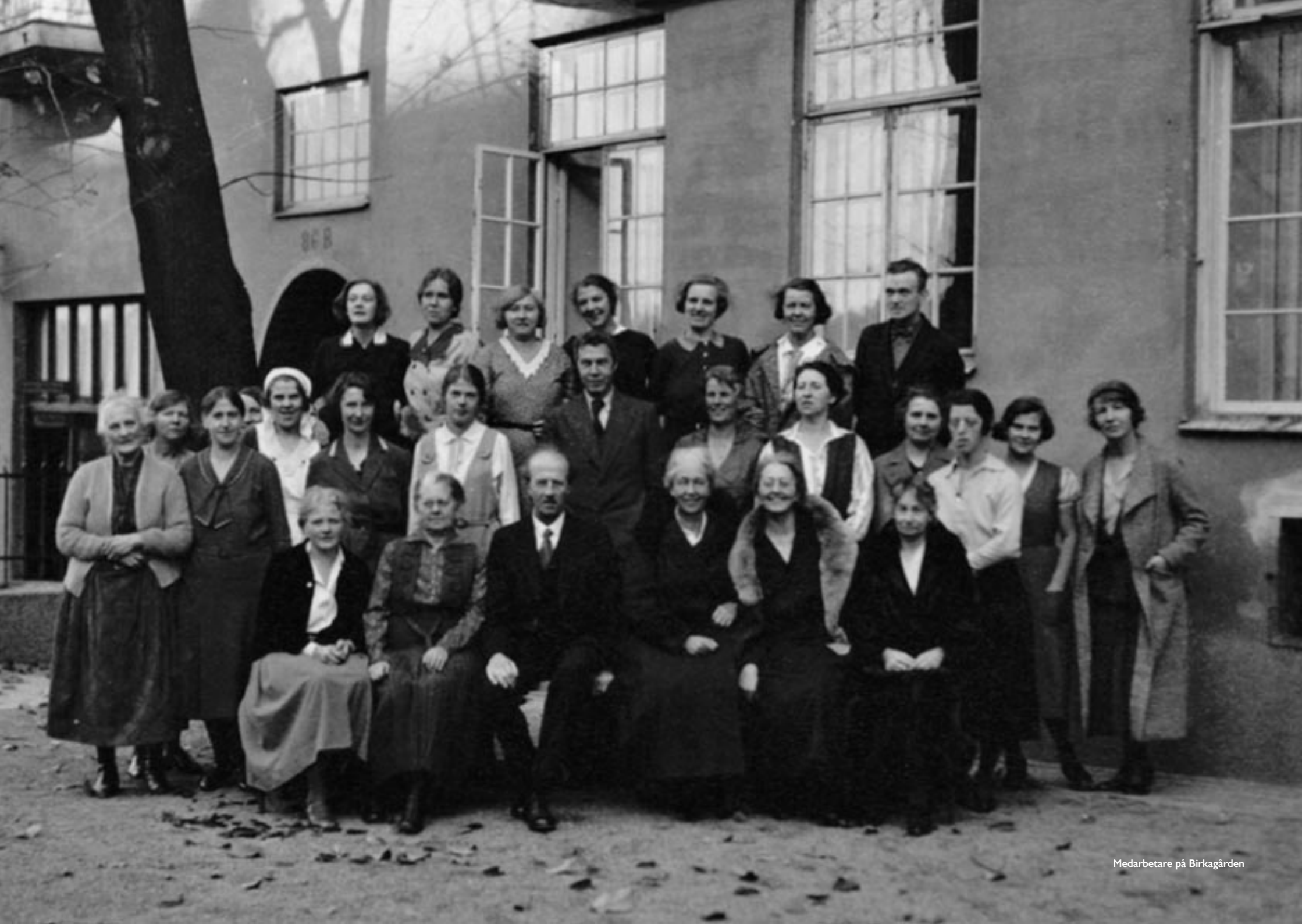
Medarbetare på Birkagården