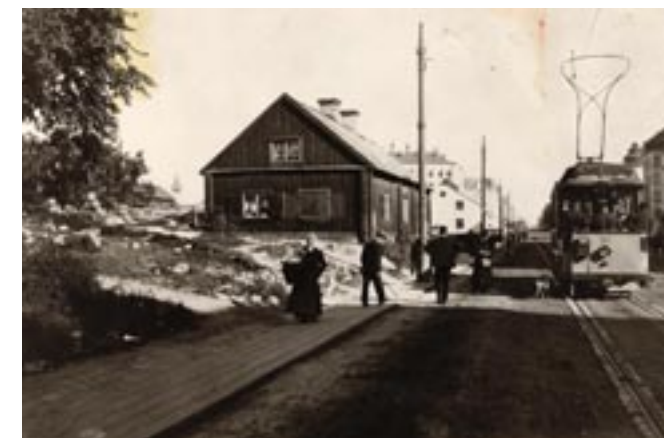
Korsningen Karlbergsvägen/Norrbackagatan. 1910-tal.

CSA kom successivt utvecklas mot att bli en paraplyorganisation för de olika organisationer som arbetade för att "den sociala frågan" skulle placeras där den så att säga hör hemma det vill säga på politiska dagordningen.