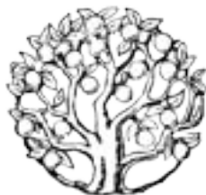
Birkagårdens symbol. En ek.